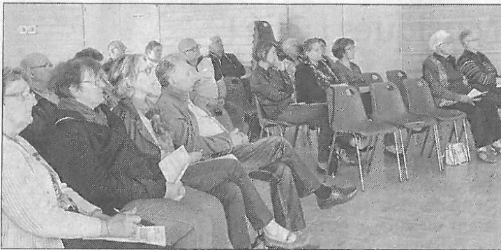
■ La conférence avait pour objectif de sensibiliser les aidants familiaux sur leur santé et leur qualité de vie au quotidien.