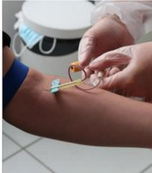
Le centre de soins infirmiers réalise également des tests sanguins. Une prise de rendez-vous est nécessaire.