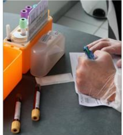
Les échantillons sont ensuite apportés au laboratoire partenaire, Lab 70, en charge de les analyser.