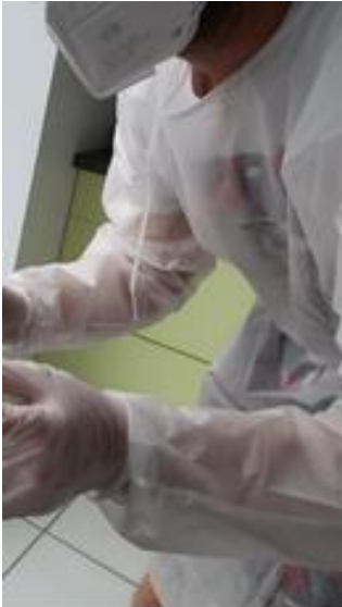
Habillé de pied en cap, l'infirmier (ère) réalise le test PCR dans le respect des règles sanitaires.