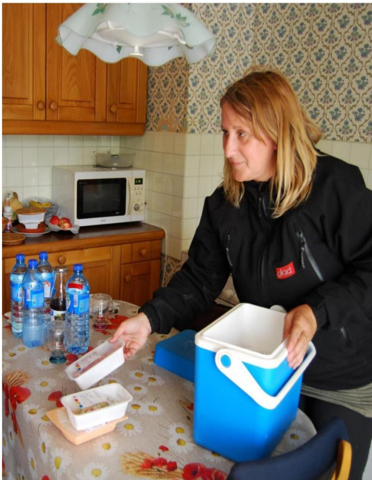
Les menus sont livrés, du lundi au vendredi chez les personnes âgées, avant midi. Elles ont le choix entre deux régimes : un normal et un diététique.