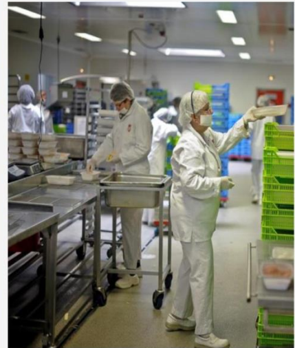
Toutes les barquettes sont étiquetées pour chaque client de la cuisine d'Uzel, puis stockées au froid.