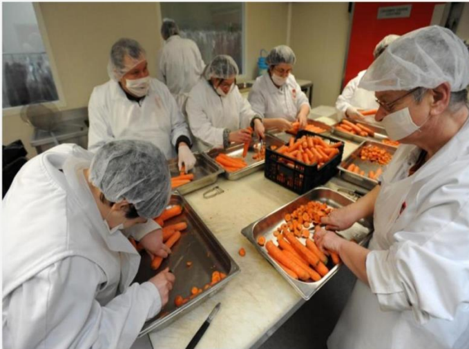
Les légumes frais proviennent de fournisseurs locaux. La cuisine d'Uzel emploie environ 80 personnes. Leurs déficiences mentales ne les empêchent pas d'être efficaces et consciencieuses.