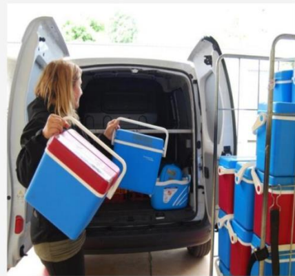
Lorsque tout est prêt, les livreurs chargent les repas dans leurs camionnettes et effectuent leur tournée.